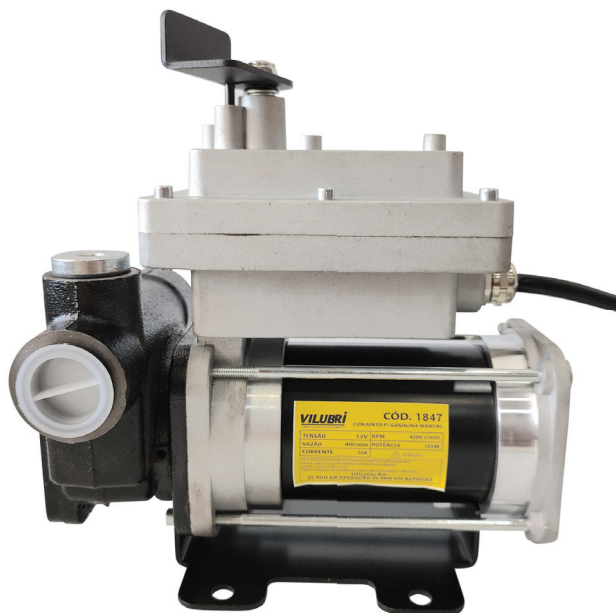
BOMBA P/ GASOLINA Código: 1847 I 1848