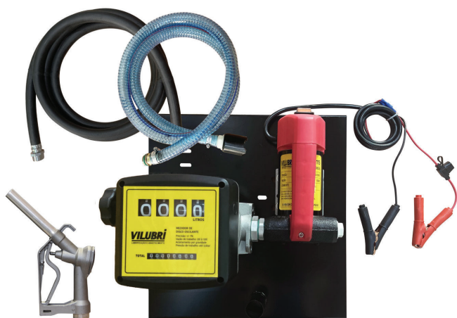
CONJUNTO P/ ABASTECIMENTO DE ÓLEO DIESEL 12V Código: 1115